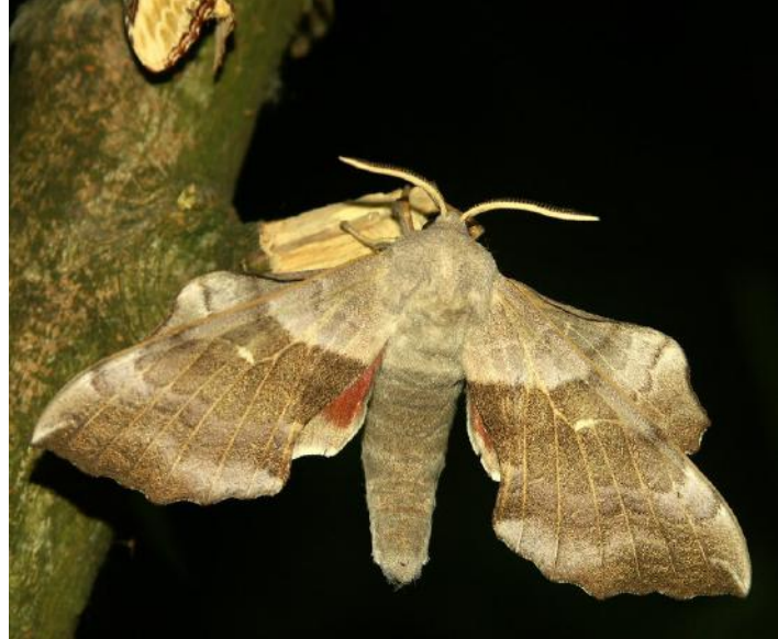
PAPILLON DE NUIT