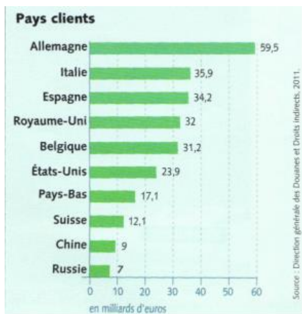
Répartition géographique des exportations de la France

1) Quelle information le document fournit-il ?