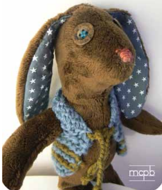
Augustin le lapin...