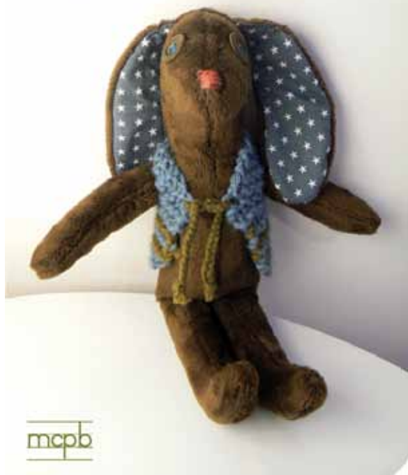
...pour aller gambader...