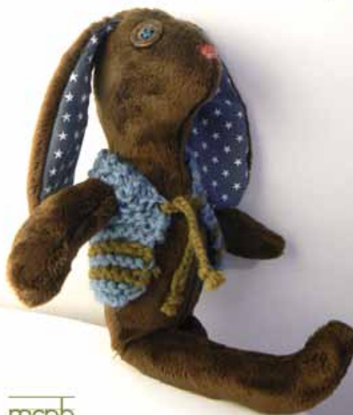
...aime mettre son gilet de berger...