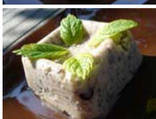
crème glacée menthe glaciale pépites de chocolat