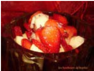
salade fraise poire et lavande