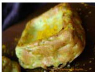
flan de courgettes