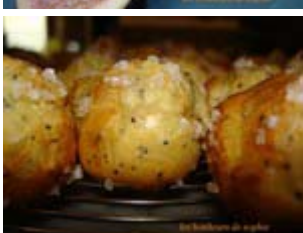
chouquettes au citron et pavot