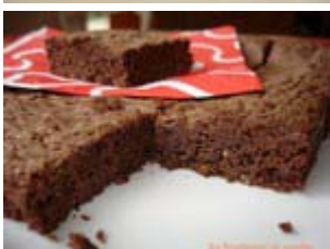
tests du livre de Pascale