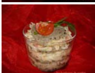
millefeuille ou verrine d'aubergine au céleri et crabe