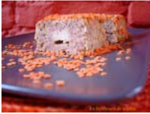
pain de porc au fromage