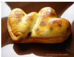
fiadone aux pépites de chocolat