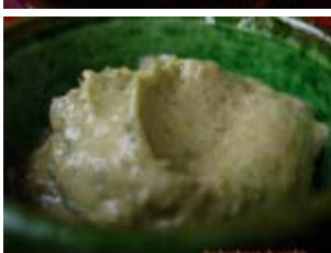
crème d'avocat à la menthe et coriandre