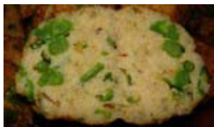
bouchées aux crevettes thaï