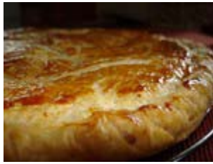
galette des rois à la frangipane de Poujauran