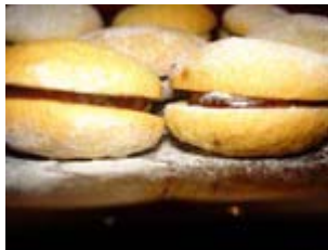
biarritz au chocolat