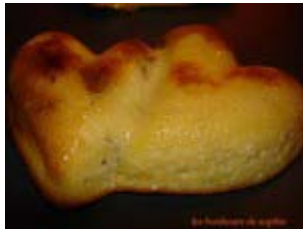
fiadone aux figues