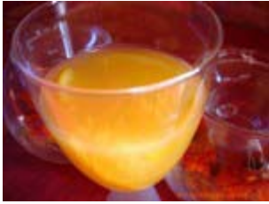
sangria au vin blanc