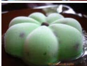
crème glacée menthe et pépites de chocolat