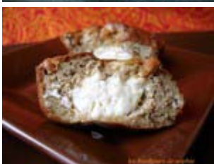
charlottes d'aubergine au coeur tendre de féta