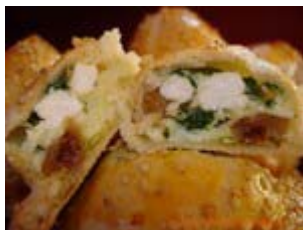
bouchées feuilletées ricotta, épinards et figes