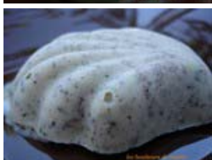
crème glacée menthe fraîche pépites de chocolat