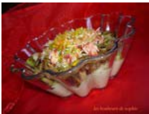
velouté de céleri aux champignons et crabe