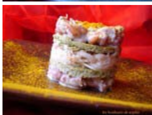
millefeuille de crevettes, céleri et brocolis au curcuma