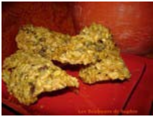
tuiles aux flocons d'épeautre et pépites de chocolat