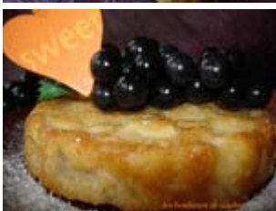
saint jean baptiste aux poires