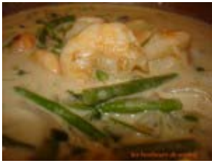
crevettes au curry vert thaï