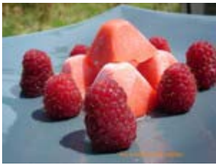
glace fraise Pomme d'Api, sans sorbetière