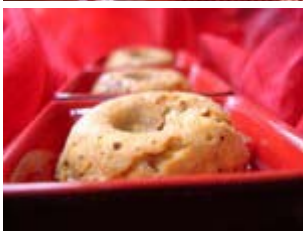
petits biscuits au muesli de Trinidad