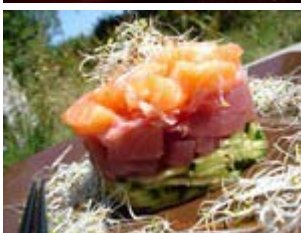
timbale de sashimi de thon et saumon