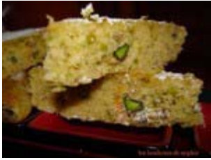
triangles à l'orange et à la pistache