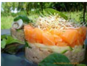
tartare de champignon et saumon