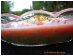
crème de courgette, pastèque et féta