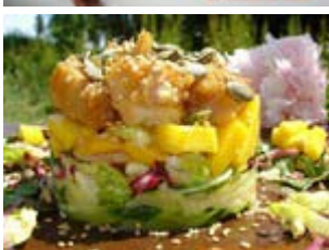
timbale de cabillaud, mangue aux graines