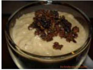
crème de champignons aux morilles