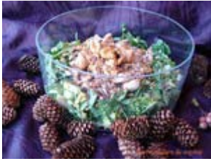
salade de pousses d'épinards au poulet caramélisé