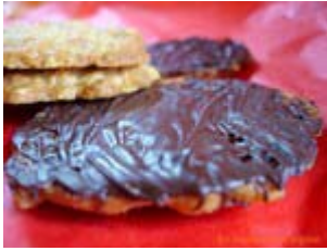
cookies à l'avoine et chocolat (copie des biscuits d'Ikea)