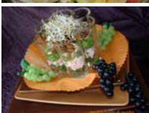
salade vitalité de poulet fumé