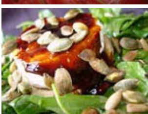
crottin de chèvre sur artichaut au sirop de Liège