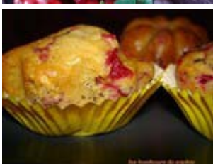
muffins au cranberry