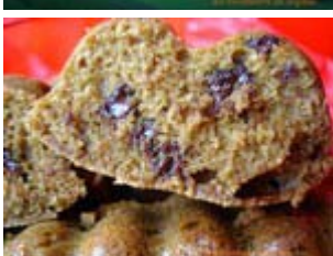
cakes au sucanat et pépites de chocolat