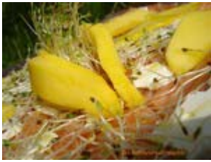
carpaccio de saumon, féta et mangue