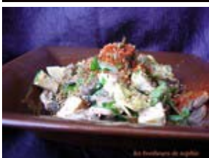
poêlée de légumes thaï