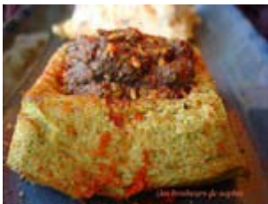
quenelles de poulet et flan de brocolis, caviar champignons/morilles