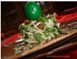
timbale de rémoulade de céleri aux fruits, herbes et pecorino