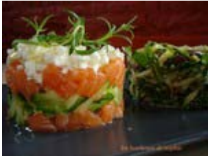
tartare de saumon et féta au romarin