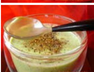
velouté mousse de courgettes à la roquette