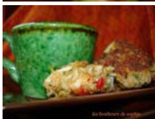
galettes de crabe