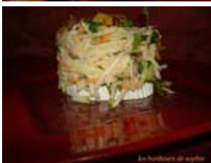
timbale de rémoulade de céleri printanier au chèvre et figues