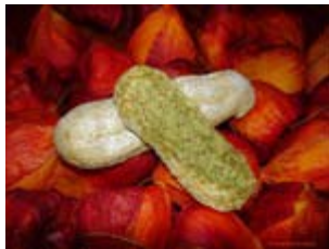
biscuits à la cuiller