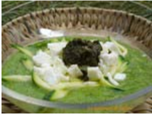
verrine de courgette à la féta et pesto