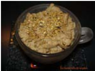
tartina aux champignons de clea