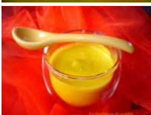
velouté de potimarron au lait de coco et curcuma