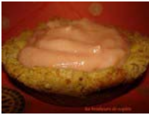
tartelettes orange curd et cardamome