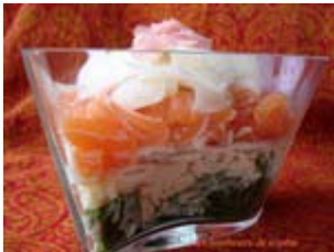
verrine de saumon céleri et roquette