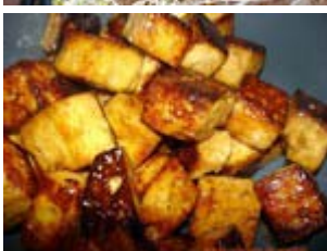
tofu préféré (mon)