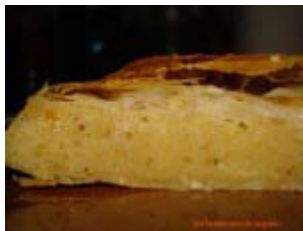
galette des rois aux amandes, allégé en beurre