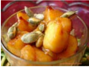
salade de joues de lotte caramélisées