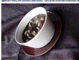
fondant au chocolat