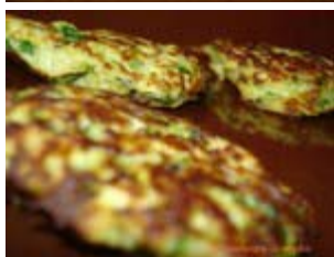
galettes de courgette et manouri