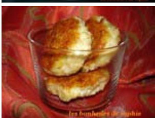
croquettes de poulet pour les enfants