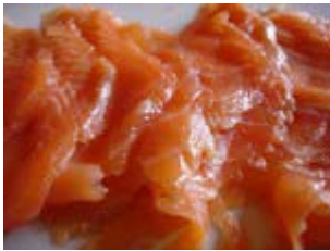
gravad lax ou saumon mariné à la Danoise