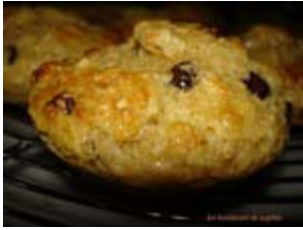
muffins santé au son d'avoine, brocciu et pépites de chocolat