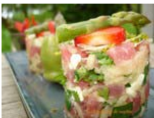
tartare de thon, féta, poire et coriandre au coulis d'asperge et fraises