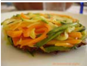
tatin de légumes