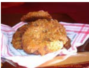
palets aux flocons d'épeautre