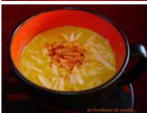
velouté de chicons