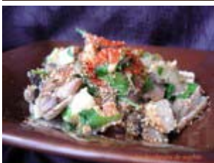
salade tiède de champignons et tofu