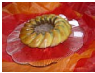
marbré choco pistache