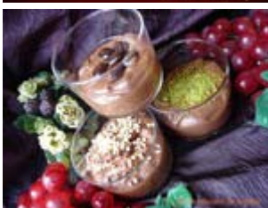
mousse légère au chocolat variations