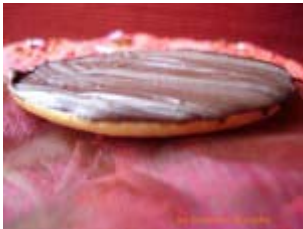
palets aux amandes et chocolat