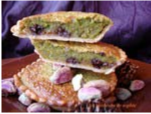
tartelettes aux pistaches