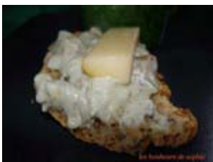
tartina de roquefort et poires