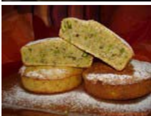
cakes à la cardamome et aux pistaches