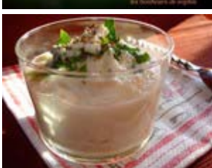
crème de céleri, roquefort et cumin