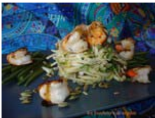
crevettes sautées et chicons en salade