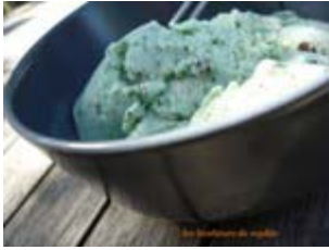
crème glacée menthe pépites de chocolat