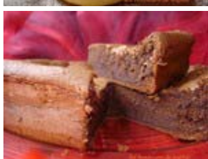
gâteau au chocolat Bellevue de Christophe Felder