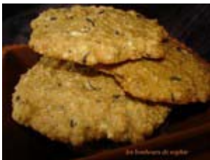
cookies au thé earl grey et bergamome, version sans gluten