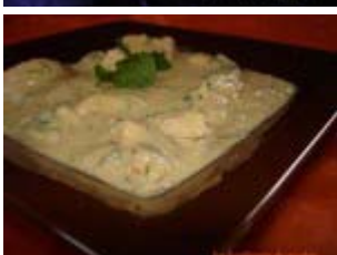
poulet de curry thaï