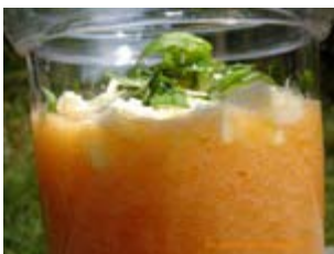
verrine de soupe de melon à la féta et basilic