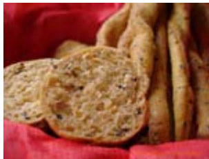
bâtonnets au pesto rouge