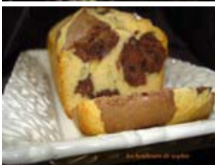
cake marbré au chocolat et aux amandes de Béatrice Thibault