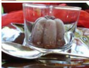
crème glacée légère au chocolat