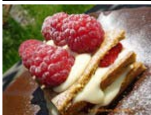
mille feuille earl grey, vanille et fraise framboise