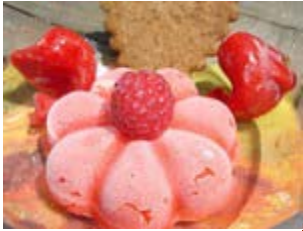
sorbet framboise et fraise