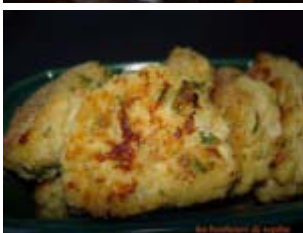
croquette de poulet thaï Ken Hom