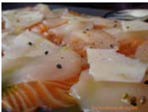
carpaccio de saumon, saint jacques à la cardamome