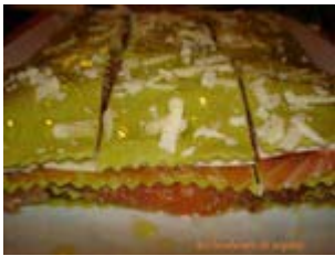
lasagne au saumon gravad lax et pecorino