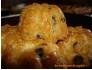
bouchées légères aux pépites de chocolat