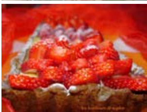
tarte aux fraises et framboises sur lemon curd et spéculoos