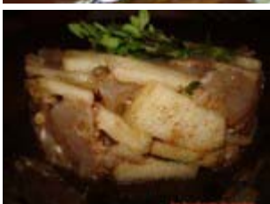
tartare de daurade, poires, gingembre et cannelle