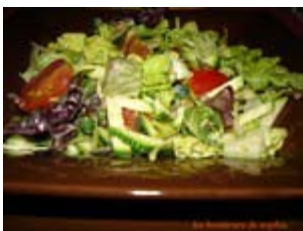
salade préférée du moment