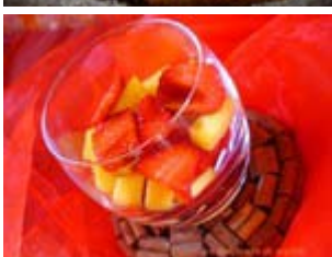
salade de fraise et mangue au vinaigre balsamique