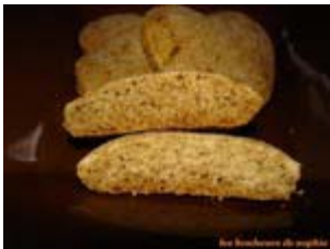
speculoos santé, allégé en beurre et sucre