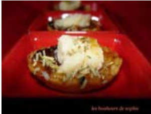
confit de chicons et tartelettes confit chicons, manouri et romarin