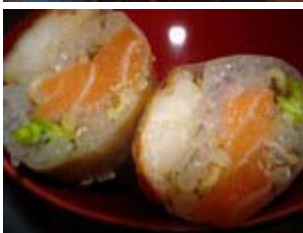
rouleaux de printemps aux crevettes et saumon cru