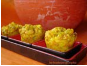
mini muffins tomate, pecorino et raisins