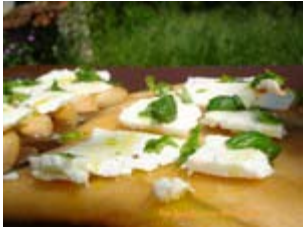
carpaccio de melon à la féta