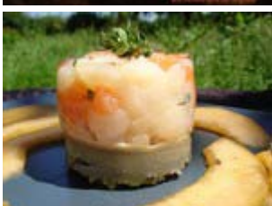
tartare de saint jacques et saumon, artichaut et carpaccio de melon