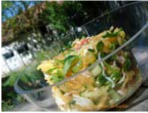
verrine de crabe et papaye à la vanille