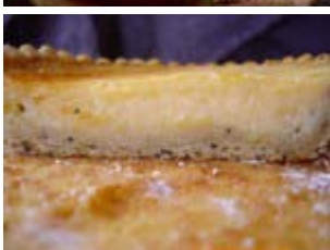
tarte légère au citron et pamplemousse