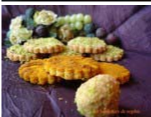
sablés sans gluten, KKVVKV 7