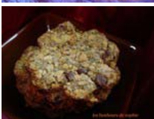
cookies menthe et pépites de chocolat