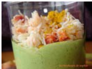
crème de roquette aux poires et crabe