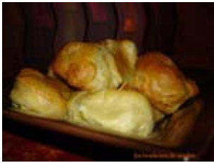
gougères au chèvre et à la féta