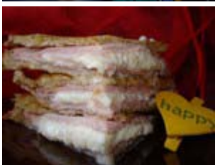
croque crousti moelleux