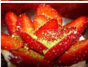
tarte aux fraises et pistaches