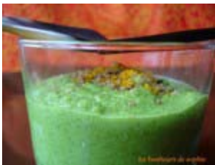
mousse de brocolis