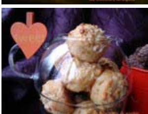
muffins Maya l'abeille de Clea