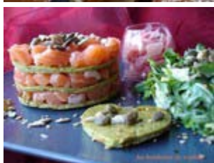
millefeuille de brocolis et tartare de saumon