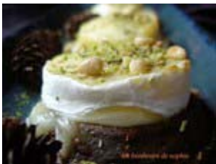
cabécou sur aubergine aux pignons et pistaches