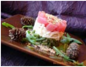
timbale de haricots vert, céleri et thon