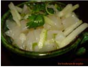
tartare de saint-jacques aux pommes