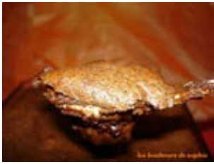
gâteau mousse after-eight