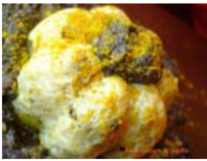
quenelles de poissons aux morilles et cœur de brocolis