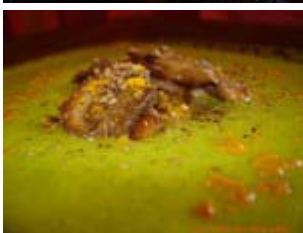
velouté de courgettes aux champignons, gomasio et curcuma