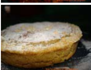
torta della nonna adaptée sans lactose