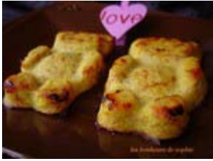
quenelles de jambon au curcuma