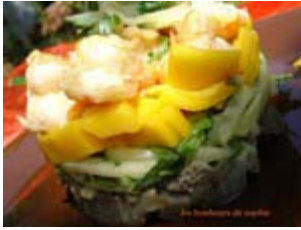
timbale de crevettes sautées au gingembre en salade