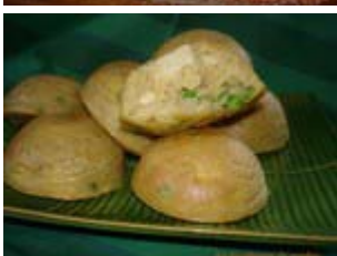
cakes au crabe, petit pois, tofu et lait de soja