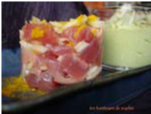
tartare de thon au gingembre et crème de brocolis aux poires