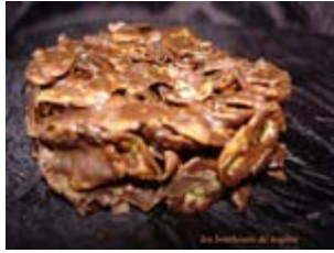
croustillant au chocolat