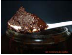
fondant au chocolat allégé