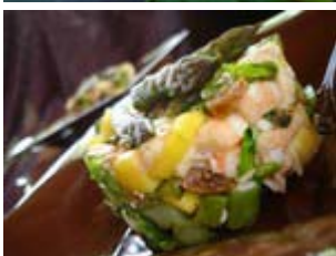
tartare de crevettes, asperges et mangue