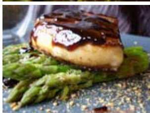
foie gras poêlé aux asperges vertes et purée de champignons