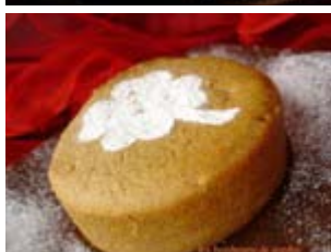
gâteau au café