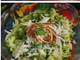
salade tiède de légumes au brebis des Pyrénées et figues