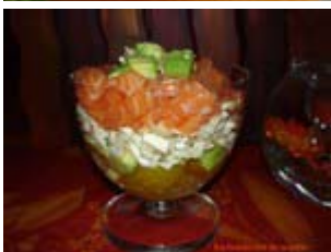
verrine de tartare de saumon, avocat, champignons