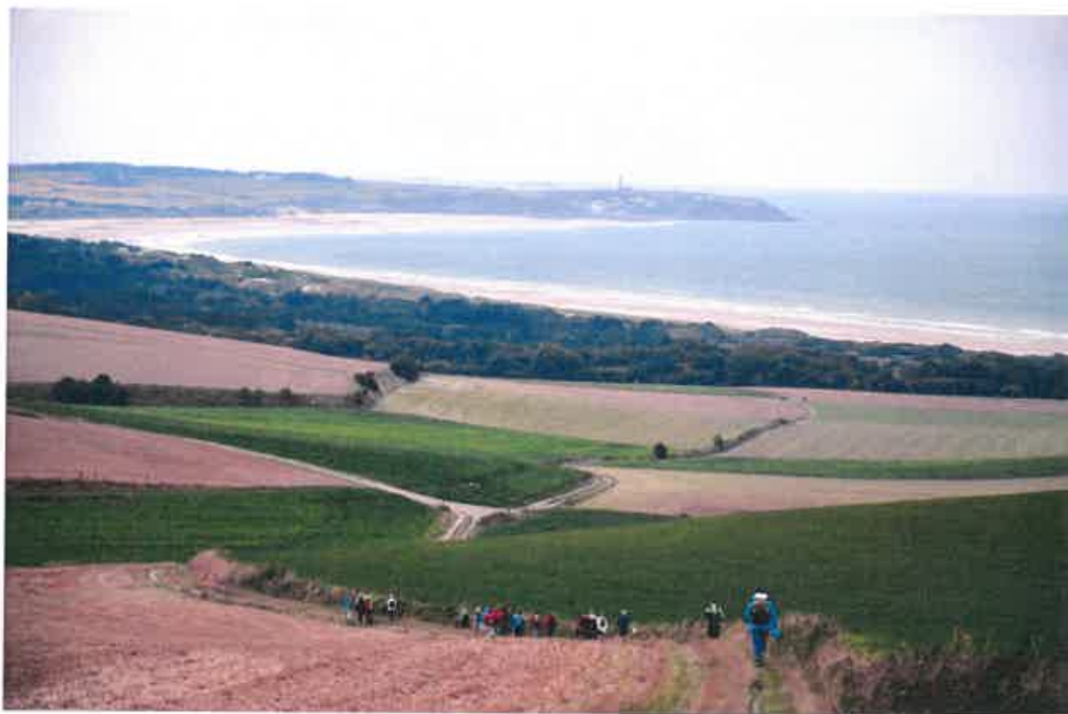
HARMONIE ENTRE TERRE, CIEL ET MER

Espérons que cette nouvelle activité permettra de retrouver "nos anciens" et attirera un public nouveau désireux de conserver la santé et retrouver la convivialité.