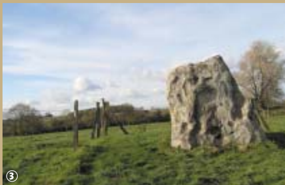
Le Menhir ou « Gros Caillou »

Tout le monde le sait, c'est bien connu ! Les filles naissent dans les roses et les garçons dans les choux... Et bien détrompez-vous, cette légende n'est pas vraie partout ! A Vendegies-sur-Ecaillon, on racontait aux enfants du village que les mamans allaient chercher les bébés sous la pierre... Mais quelle pierre ? Il s'agit de la Grosse Pierre.