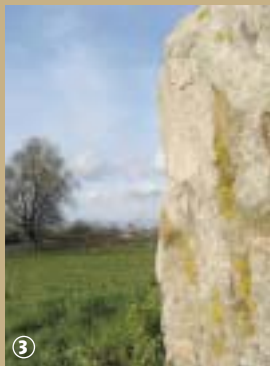
Le Menhir ou « Gros Caillou »

Encore appelée « Gros Caillou » ou « Grès de Montfort », ce bloc de grès, à la forme d'un prisme trapézoïdal, intriguait les petits qui y collaient leur oreille afin d'entendre les bébés pleurer !