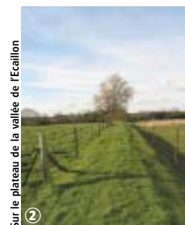
Sur le plateau de la vallée de l'Ecaillon