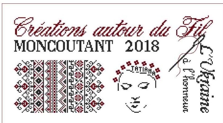
Diagramme point de croix 209 X 102 points