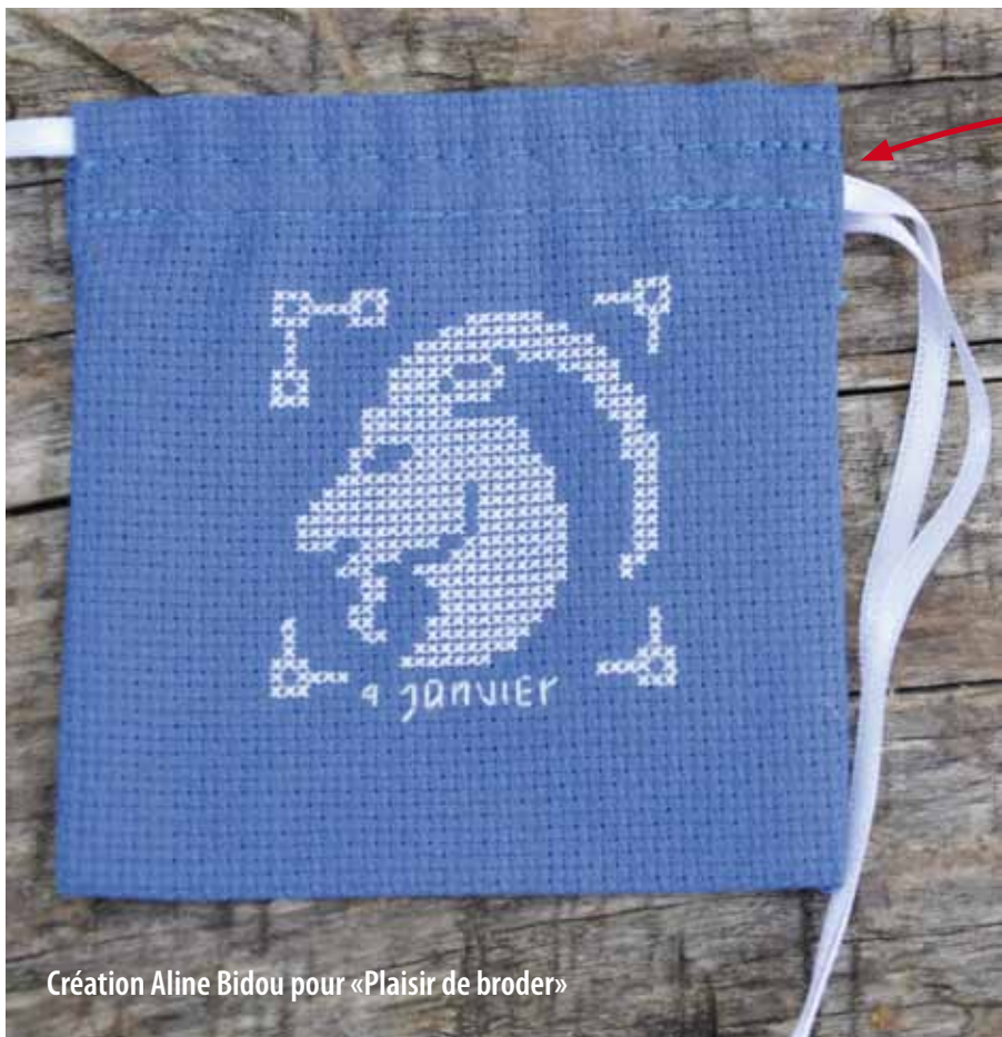
Création Aline Bidou pour «Plaisir de broder»

Retrouvez les grilles complètes du Capricorne et du Verseau dans Plaisir de broder n° 31.