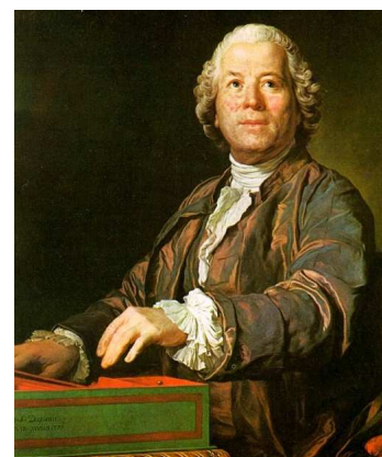
Christoph Willibald GLUCK