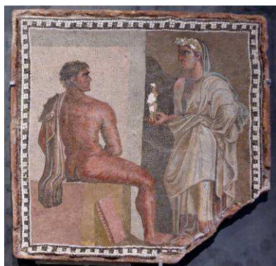
Oreste et Iphigénie

Mosaïque romaine, II - IIIe s. après J.-C.