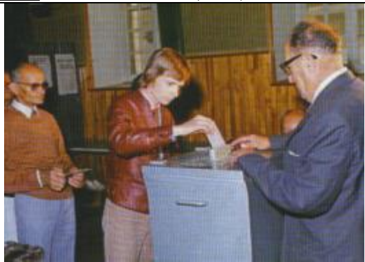
Doc 5 : Le vote à 18 ans (1974)