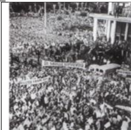
Sur les banderoles, on peut lire « Algérie française » et « de Gaulle au pouvoir »

Doc 2 : les militaires prennent le pouvoir