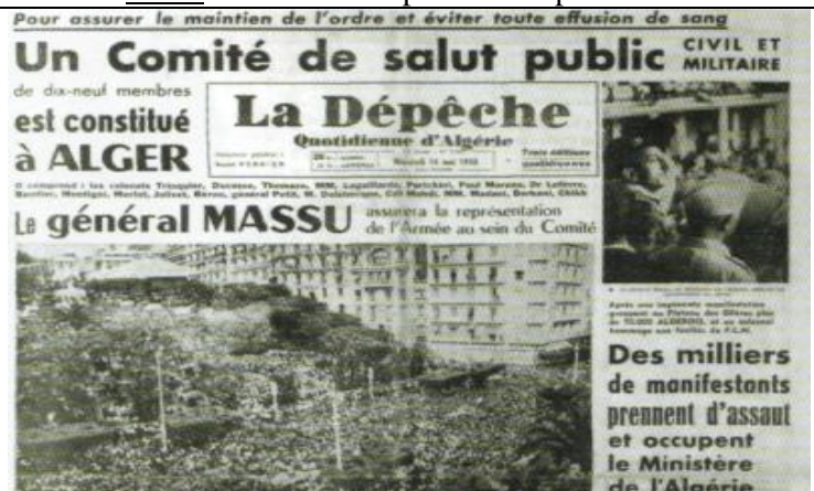
La Dépêche quotidienne d'Algérie, 14 mai 1958

Doc 2 : les militaires prennent le pouvoir