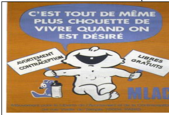
Doc 7 : Affiche en faveur de la contraception et de l'IVG (1975)