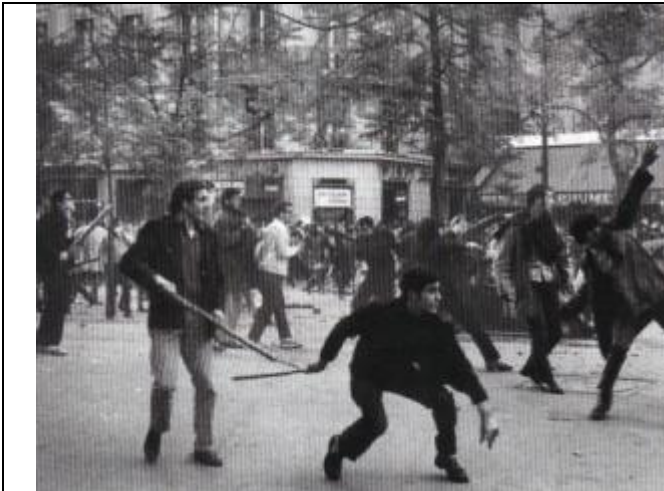
Doc 6 : Les manifestations de Mai 1968