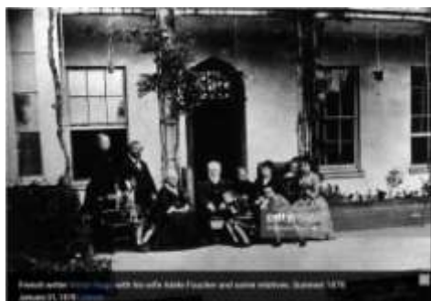
Victor Hugo en 1878

© Jean-François Lecaillon, juin 2018 © Mémoire d'Histoire, Paris.