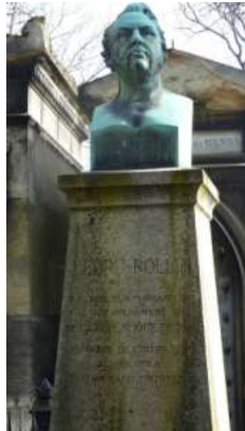
Monument à Ledru-Rollin

Les centenaires de la disparition de Voltaire et de Rousseau sont des occasions plus franches de témoigner de la bataille des symboles. La célébration de la mémoire de Voltaire suscite de vives critiques de la droite conservatrice. L'anticlérical Voltaire la rebute. Le 1 er juin, Le Gaulois dénonce les provocations. Fourcaud dénie l'idée que la journée soit une fête. Même tonalité dans Le Journal des débats politiques et littéraires où il est dit que les « fêtes en l'honneur de Voltaire indiquent que notre époque est tombée bien bas » ! L'anniversaire semble ainsi être l'occasion de ressortir les couteaux ! Mais les républicains évitent le piège qui leur est tendu et Le National du 1 er juin peut se féliciter que les cérémonies n'aient pas été troublées par les conservateurs cléricaux. L'anniversaire s'efforce de s'inscrire dans le cadre de la « piété patriotique », sentiment bien partagé.