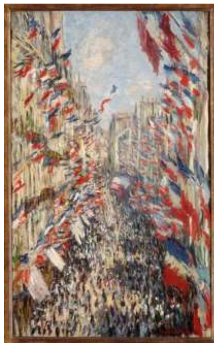
Claude Monet, La rue Montorgueil

L'année invite aussi à la célébration de deux anniversaires prestigieux : le centenaire de la mort de Voltaire le 30 mai et celui de la disparition de Rousseau le 2 juillet. Une célébration conjointe a été fixée au 14 juillet – la date n'est pas encore fête nationale – pour ne pas avoir à choisir le 30 mai plutôt que le 2 juillet ou l'inverse. Là encore l'État reste en retrait de toute cérémonie. Les manifestations sont laissées à l'initiative des maires. Cette liberté profite à Voltaire. Un comité d'organisation se met en place pour commémorer sa mémoire. À Paris, Victor Hugo est à nouveau sollicité. Le 30 mai, il prononce un discours largement diffusé par la presse. L'anniversaire de Rousseau est, en revanche, plus discret. Une exposition iconographique lui est bien consacrée au pavillon de la Ville de Paris de l'Exposition universelle, mais le projet d'associer le centenaire des deux philosophes à la date du 14 juillet a moins d'écho. La droite ne ressent aucune envie d'honorer les deux philosophes et la gauche modérée ne se montre pas empressée d'évoquer la mémoire de Rousseau. Le peu