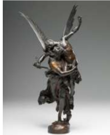
Antonin Mercié, Gloria Victis !

Dans ce contexte, Quand même ! d'Antonin Mercié (1874), œuvre autrement connue sous le titre évocateur de Gloria Victis ! occupe une place de premier choix et son créateur reçoit pour l'occasion la médaille d'honneur de l'Exposition. Peut-on imaginer plus provocante manière de déclarer au monde que le vainqueur de 1870 n'est pas celui que le sort des armes a consacré ? Tous ces fastes artistiques font contrepoint aux ruines de l'Hôtel de Ville (en cours de reconstruction) et celles des Tuileries – symbole des régimes déchus. Ces stigmates de l' Année terrible se dressent encore au cœur de Paris. Or, la guerre des symboles choisit de